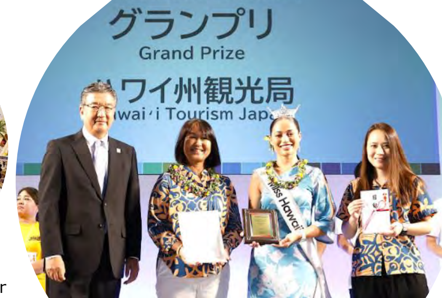
TOURISM EXPO JAPAN