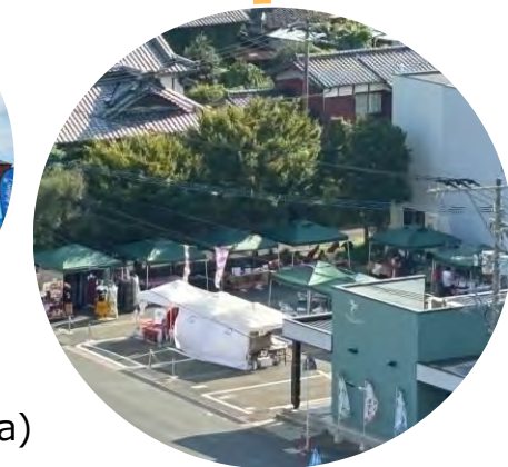
Fukuoka RKB Hawaii Fes