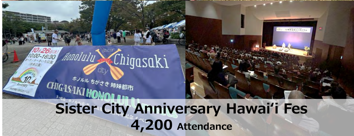
Sister City Anniversary Hawai'i Fes 4,200 Attendance