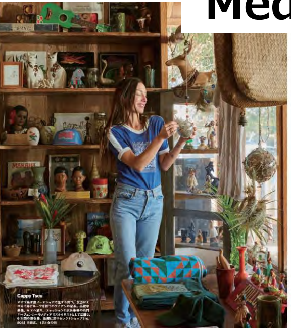
Chappy Taku オープンな空間、インテリア、アート、音楽、ファッション、ライフスタイル、ワイキキのファッションデザイナーの月とあけはら。

幸せな瞬間をそのまわりの人々と共有したい。ワイキキのファッションデザイナーの月とあけはら。ワイキキのファッションデザイナーの月とあけはら。ワイキキのファッションデザイナーの月とあけはら。