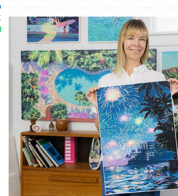
今回のプレゼントアート。ワイキキの花火を描いたアート。「フライデー・ファイヤーワークス」。