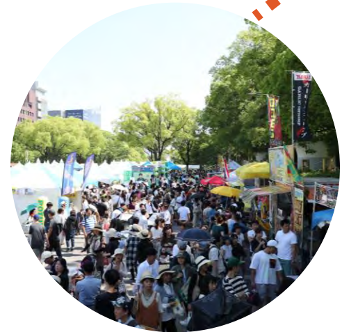
Nagoya JST HAWAI'I Festival