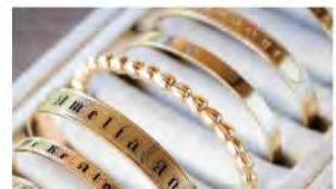
伝統とモダンな美しさの融合が実現。ジュエリーの紹介。