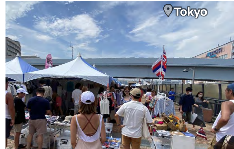
ALOHA ODAIBA 160,000 Attendance