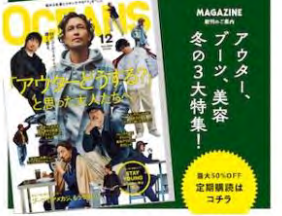
MAGAZINE アウター、ブーツ、美容 冬の3大特集！ 定額購読は コナラ