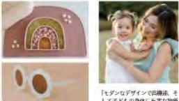
モダンなデザインで保護。キッズアイテムの紹介。