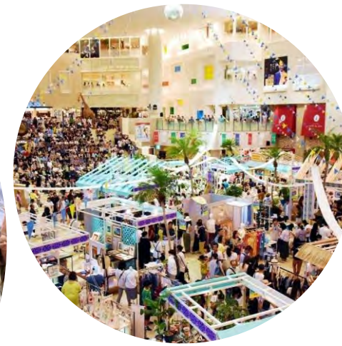
Hankyu Umeda Hawaii Fair