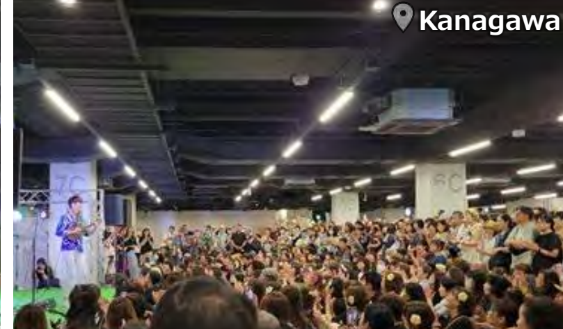
Ukulele Picnic 20,000 Attendance