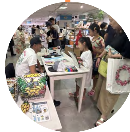
Takashimaya Hawaii Fair