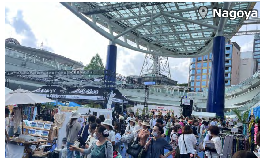
JST HAWAII Festival 320,000 Attendance