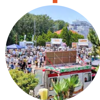
Chigasaki Aloha Market