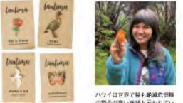
ハワイは世界で最も鳥類多様性豊かな島。鳥類の保護活動。