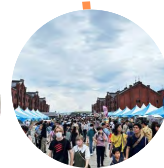
FUN ALOHA (ALOHA Yokohama)