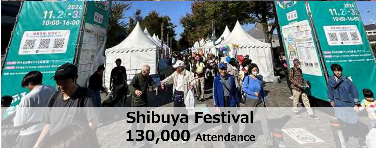
Shibuya Festival 130,000 Attendance