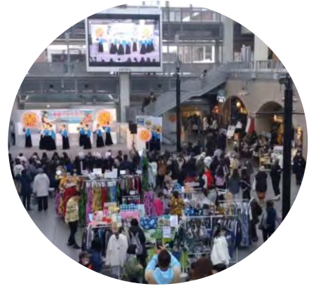
Tokonatsu Aloha Fes in Sapporo