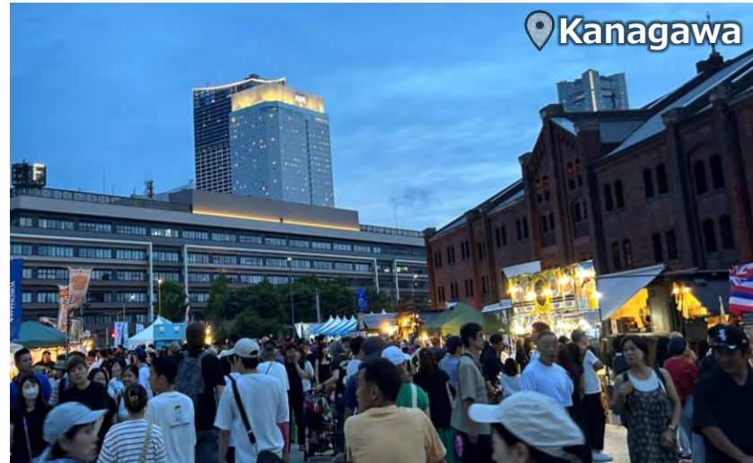
FUN ALOHA 110,000 Attendance