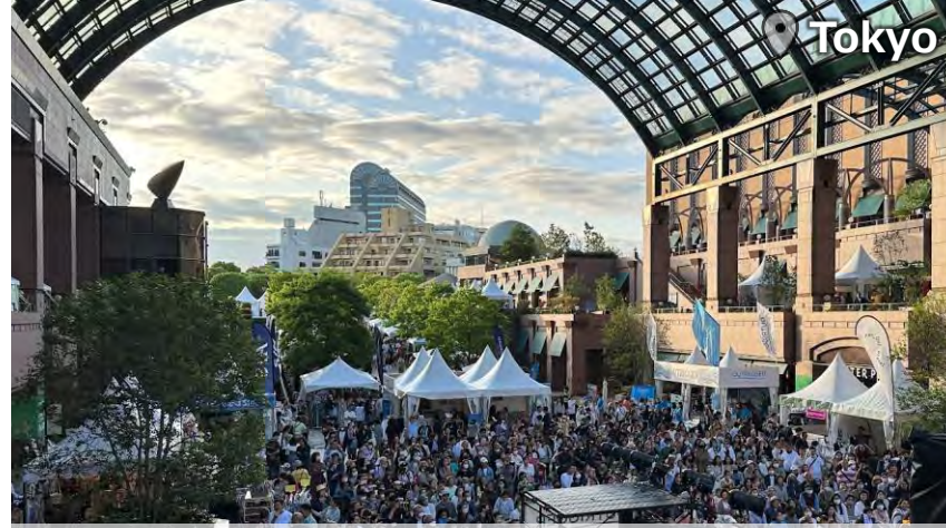
ALOHA TOKYO 185,000 Attendance