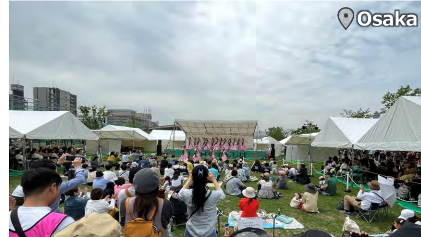
ALOHA Tenshiba 2024 20,000 Attendance